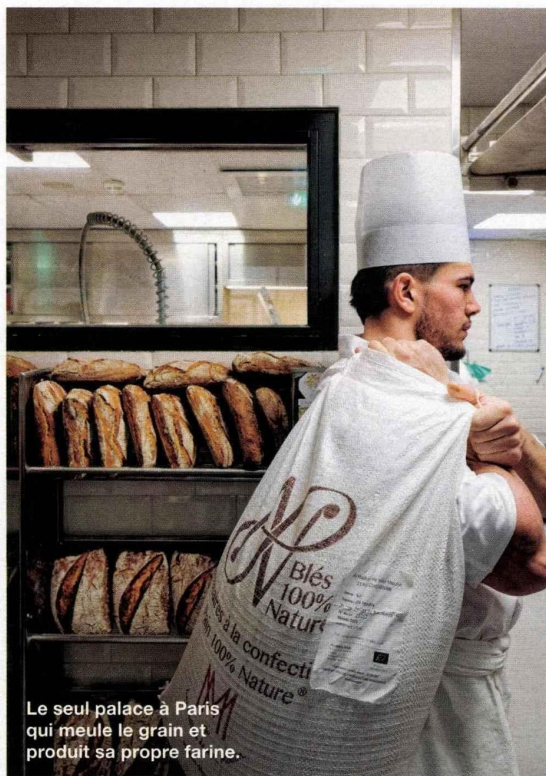
Le seul palace à Paris qui meule le grain et produit sa propre farine.