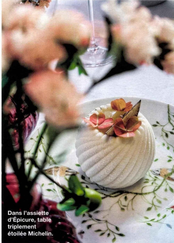
Dans l'assiette d'Épicure, table triplement étoilée Michelin.