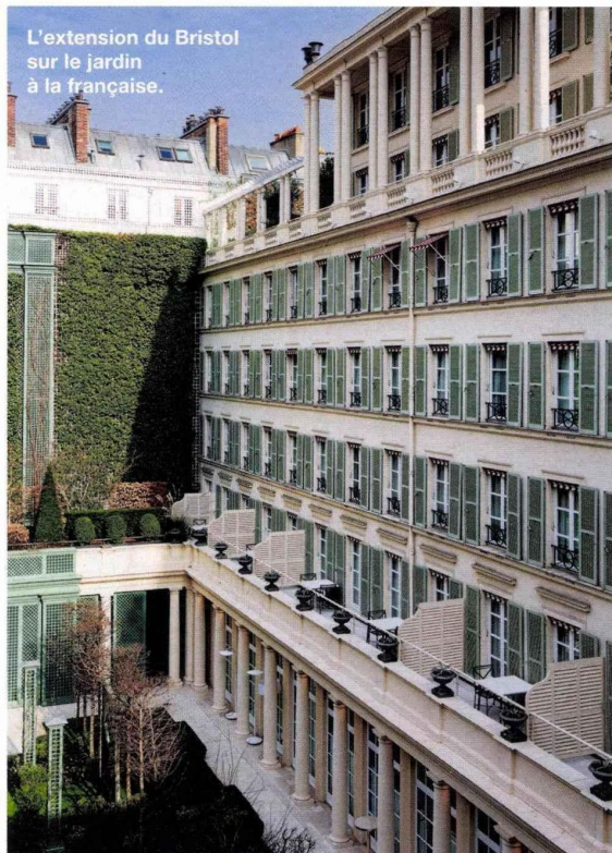
L'extension du Bristol sur le jardin à la française.