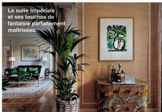
La suite Impériale et ses touches de fantaisie parfaitement maîtrisées.