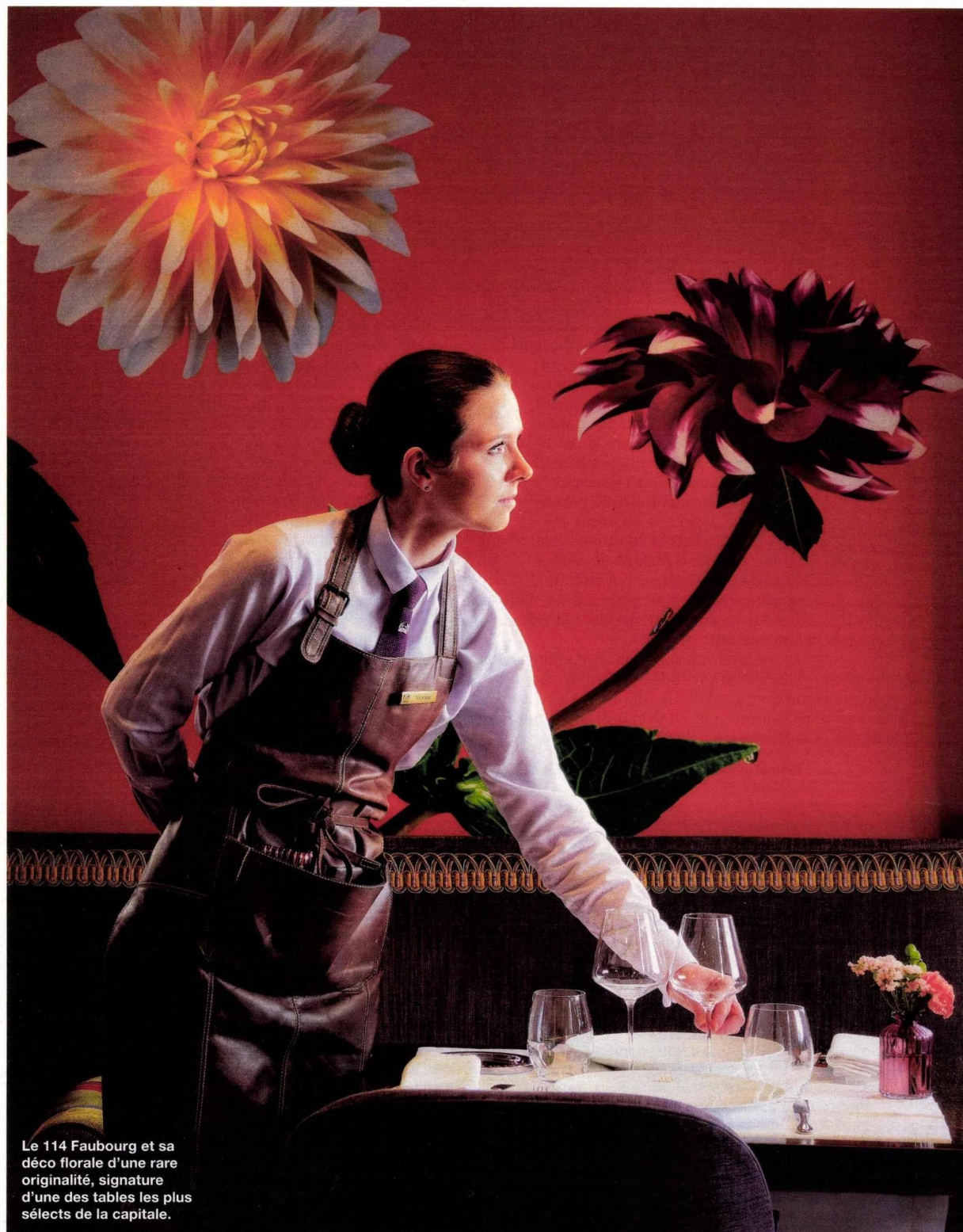
Le 114 Faubourg et sa déco florale d'une rare originalité, signature d'une des tables les plus sélects de la capitale.