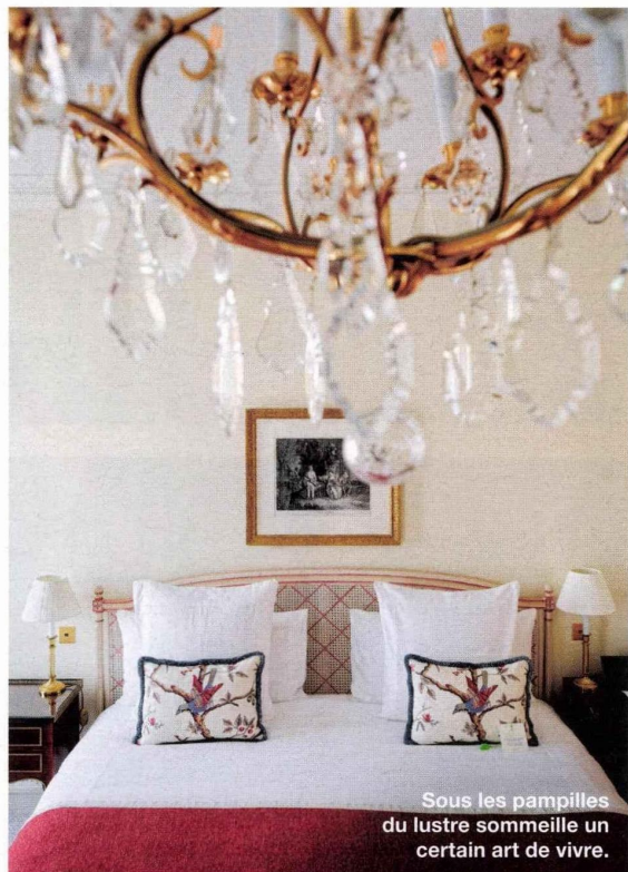
Sous les pampilles du lustre sommeille un certain art de vivre.