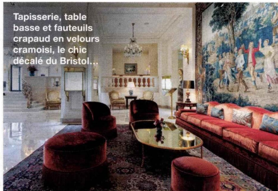
Tapiserie, table basse et fauteuils crapaud en velours cramoisi, le chic décalé du Bristol...

Tout d'abord chassons de notre esprit une idée reçue. Non. Le Bristol ne doit pas son patronyme à la petite carte de visite du même nom, mais à un évêque et aristocrate anglais, épris d'art et de voyage : sir Frederick